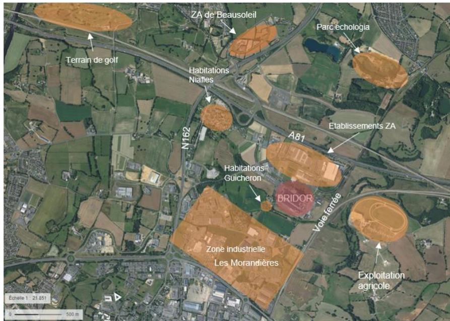
Figure 3 : Environnement proche du site BRIDOR

Depuis le précédent dossier d'autorisation environnementale de 2017, l'environnement du site a peu évolué.