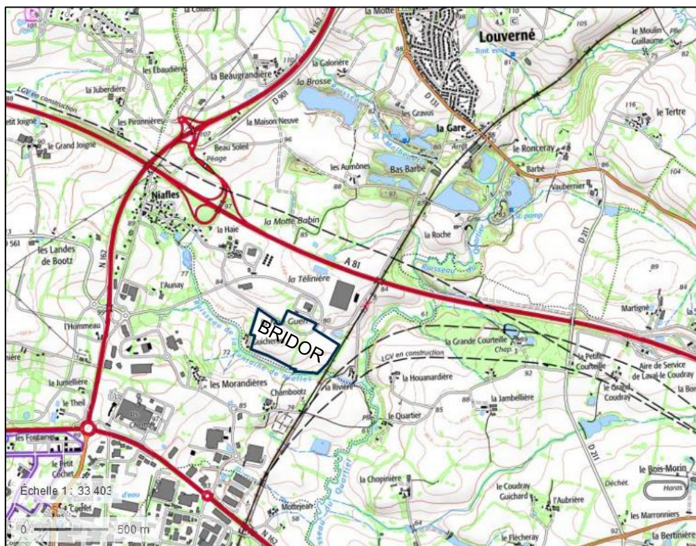
Figure 2 : Localisation du site Bridor (Géoportail)

Le plan suivant permet de visualiser l'environnement autour du site Bridor.